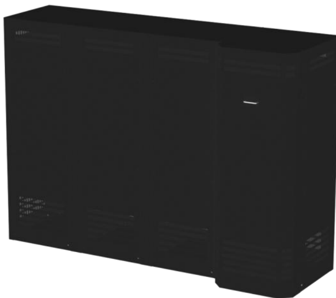
Сборка стеллажа СА-40-250 (М) с секцией на широкой стороне