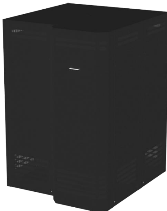
Сборка стеллажа СА-40-250 (М) с секцией на узкой стороне